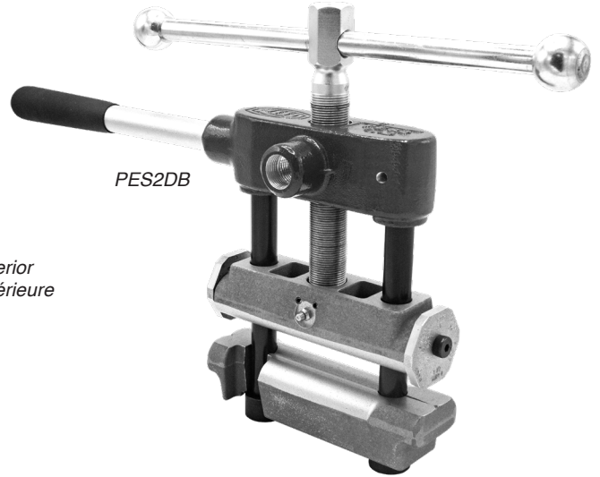
Figure / Figura / Figure: B